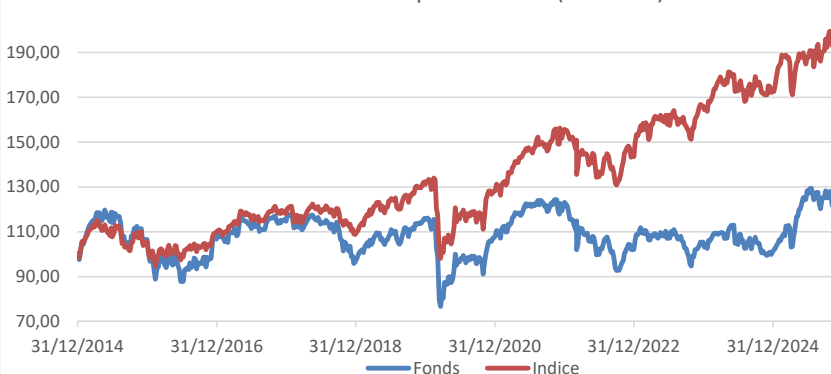
Evolution de la performance (base 100)